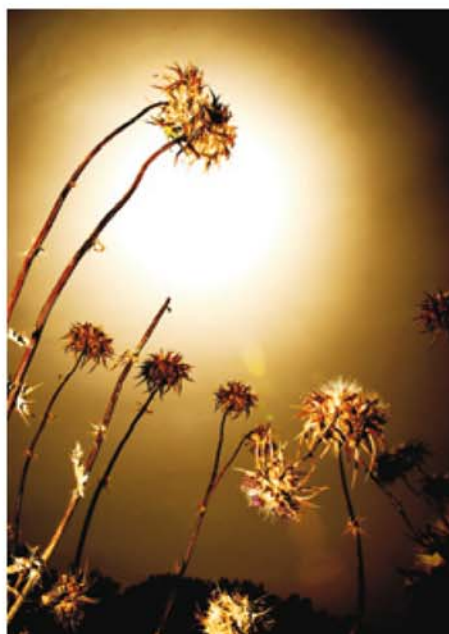
"Árido" de Ralf Pascual Izarra. Foto ganadora de 2007 en la sección de Transgénicos