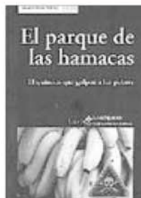
EL PARQUE DE LAS HAMACAS EL QUÍMICO QUE GOLPEÓ A LOS POBRES Vicente Boix Borney Icaria 318 páginas

Molestias en las piernas que se intensifican durante la tarde, dolores que impiden conciliar el sueño, menor capacidad de concentración en el trabajo... Todos estos síntomas son causa de un cuadro frecuente pero poco reconocido denominado Síndrome de Piernas Inquietas. Su gravedad es variable, pero la información es un complemento necesario para conocer las causas de la enfermedad.