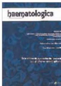
HAEMATOLÓGICA: GUÍA CLÍNICA DE QUELACION DEL PACIENTE CON SÍNDROME MIELODISPLÁSICO Acción Médica 10 páginas